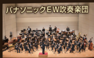
パナソニックEW吹奏楽団