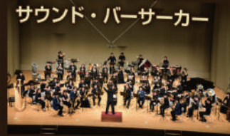
サウンド・パーサーカー