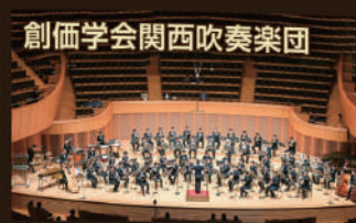
創価学会関西吹奏楽団