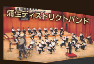
蒲生ディストリクトバンド