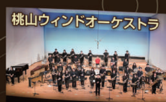
桃山ウインドオーケストラ