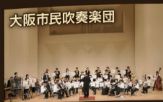
大阪市民吹奏楽団