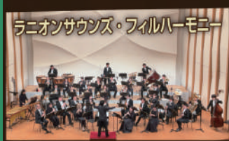
ラニオンサウンズ・フィルハーモニー