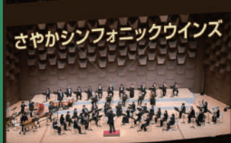
さやかシンフォニックウィングス