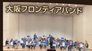
大阪フロンティアバンド