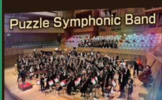
Puzzle Symphonic Band