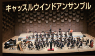
キャッスルウインドアンサンブル