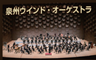
泉州ウインド・オーケストラ