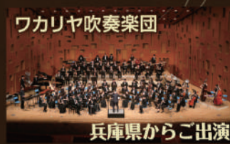
ワカリヤ吹奏楽団