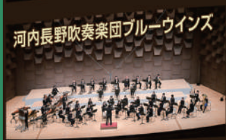
河内長野吹奏楽団ブルーウィングス